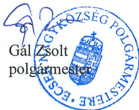
Gál Zsolt polgármester

(2) E rendelet előírásait a hatályba lépését követően indult eljárásokban kell alkalmazni.